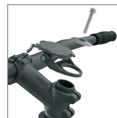
Alternative de montage 1